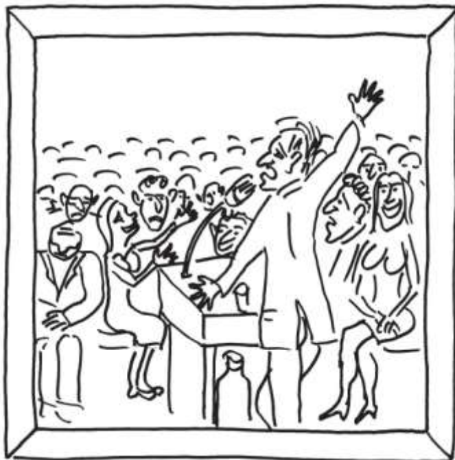
Kresba: Marián Makar Mrva